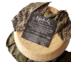
FOGLIE DI NOCE